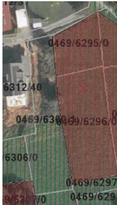
Abbildung 3 Plangebiet mit in rot markiert: gesetzlich geschütztem Biotop „Magere Flachland Mähwiese“. (Anlage Stellungnahme LRA Miltenberg 01.07.23).

Bewertung / Auswirkungen: Die Planungsfläche und der direkte Umgriff wurden begutachtet. Mit Überbauung von offenem Boden geht Lebensraum für Flora und Fauna verloren, ein Ausweichen in angrenzende Bereiche ist jedoch möglich. Der Verlust von Grünflächen führt zur Reduzierung des derzeitigen Lebensraumangebotes. Auch hier ist ein kurzfristiges Ausweichen in benachbarte Bereiche möglich. Mit der Schaffung von neuen Strukturen wird ein Ausgleich für den Flächen- und Biotopverlust geschaffen. Die Strukturvielfalt wird erweitert. Wichtig ist auch hier darauf hinzuweisen, dass die Flächen im Umgriff zukünftig nicht großflächig überbaut werden, sodass wichtige Grünlandflächen als Teillebensräume erhalten bleiben. Durch Schaffung von neuen Teillebensräumen ist mit einer ökologischen Aufwertung in der Landschaft zu rechnen.