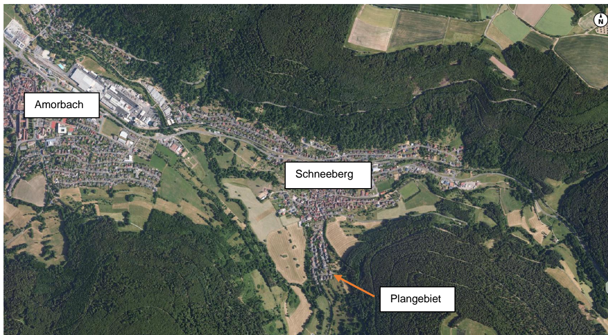
Abbildung 2 Lage im Raum - Das Plangebiet südlich im Markt Schneeberg Maßstab 1:10.000 (Geoportal Bayern, Bayerische Vermessungsverwaltung, EuroGeographics, 20.11.24).

Für die Beurteilung der Umweltauswirkungen werden drei Stufen unterschieden: geringe, mittlere und hohe Erheblichkeit.