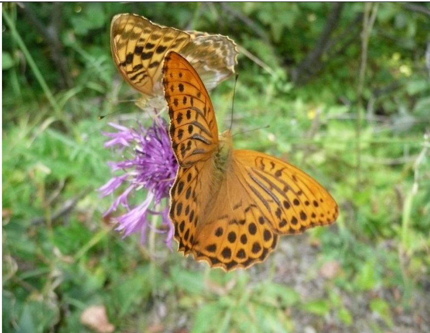
Kaisermantel ( Argynnis paphia )