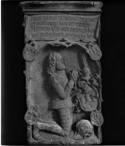
Epitaph für Hartmann Uxor von Dieburg († 1362) in der Uxor-Kapelle in Weiskirchen.

DER ODENWALD D 871 F ZEITSCHRIFT DES BREUBERG-BUNDES 69. Jahrg. Heft 4 / Dezember 2022