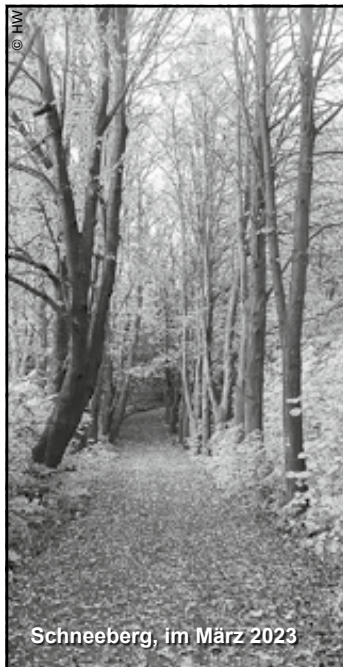
Schneeberg, im März 2023