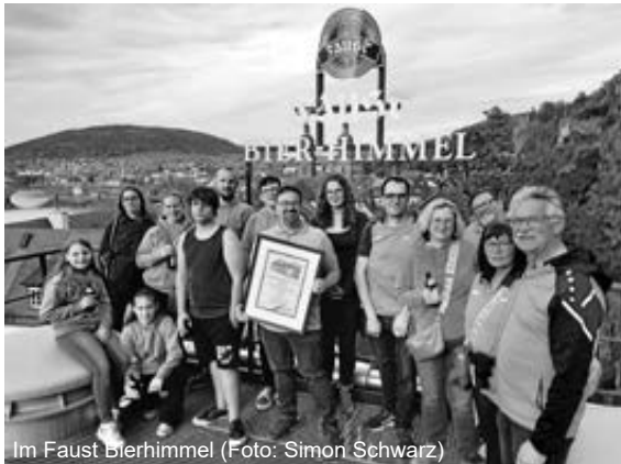
Im Faust Bierhimmel

Am 13. April 2024 lud uns die Brauerei Faust zu einer Brauereibesichtigung ein.