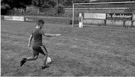
Das Runde muss ins Eckige...

Als es dann zum Abschluss neben Gratisgetränken noch ein reichhaltiges Buffet mit Wiener Würstchen, Brezen, Donuts und Muffins gab und obendrauf noch ein Armband mit Kickers-Aufdruck als Erinnerungsgeschenk, waren sich alle einig, dass das ein „supercooler Vormittag“ war und Fußball „richtig Spaß“ macht.