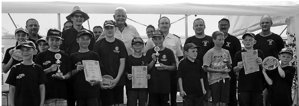
Siegerehrung der Kinderfeuerwehren - 1. Platz Breitenbuch, 2. Platz Bürgstadt, 3. Platz Hausen

Mit dem Bieranstich durch Bürgermeister Stefan Schwab wurde das Fest offiziell eröffnet. Er übergab auch eine Spende der Marktgemeinde Kirchzell. Unter dem Motto „Löschen, retten, feiern“ spielte anschließend die Stadtkapelle Amorbach zum Feuerwehrfestabend.