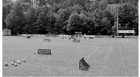
Eine der zahlreichen Übungsstationen beim rundum gelungenen Fußballtag.

Der herzliche Dank der Schulfamilie geht an jedes einzelne Mitglied des FC Kickers Kirchzell, das zu diesem erfolgreichen Event beigetragen hat.