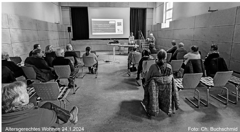
Altersgerechtes Wohnen 24.1.2024