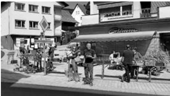
Fäggerli fuggern 2018

AUFRUF AN ALLE – Am Samstag, den 27. April 2024 veranstaltet der Obst- und Gartenbauverein Kirchzell ab 9.00 Uhr, „Fäggerli fuggern“, den „7. Pflanzenflohmarkt“ für Jedermann/Frau!!! rund ums alte Rathaus