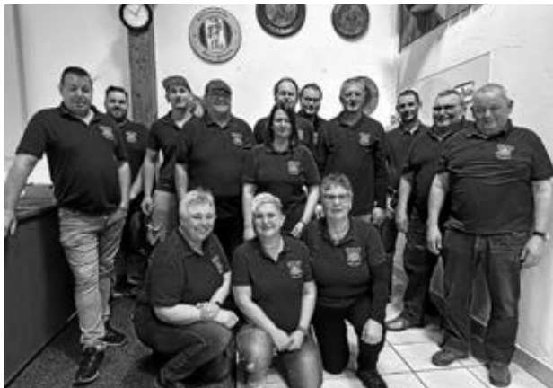
Die neue Vorstandschaft der Schneeberger Schützen

Nach einigen Diskussionen beim Punkt Verschiedenes um eine Beitragserhöhung wirft Bernhard Pfeiffer ein, das solche Vorhaben gut vorbereitet werden müssen. Dieses Thema müsse im Einzelnen in den Vorstandssitzungen nochmal besprochen werden.