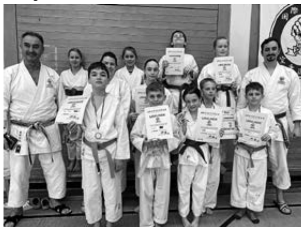
Teilnehmende des Lehrgangs in Mosbach.

Am 16.03.2024 nahm der Goju-Ryu Karateverein Amorbach e.V. an einem Kata-Vergleichswettkampf des IGKR e.V. teil. Die Veranstaltung fand unter der Teilnahme zahlreicher Dojos und Vereine in Mosbach statt. Für insgesamt 14 Teilnehmende aus Amorbach, darunter 10 Kinder unterschiedlichen Alters und verschiedener Kyu-Grade, startete der Tag mit einem gemeinsamen Training und Aufwärmen unter der Leitung von Hanshi Tokio Funasako.