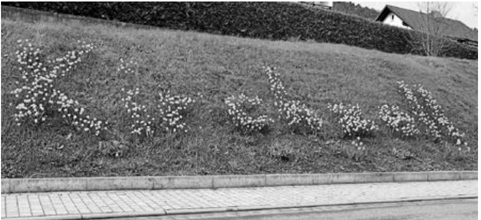
Blütengruß in Kirchzell

Informationen gibt es unter 06152-86459.